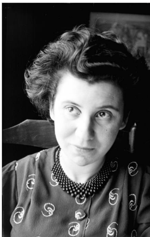
Etty Hillesum

Meer informatie over Etty Hillesum is te vinden op de website van het in Middelburg gevestigde Etty Hillesum Onderzoek Centrum.