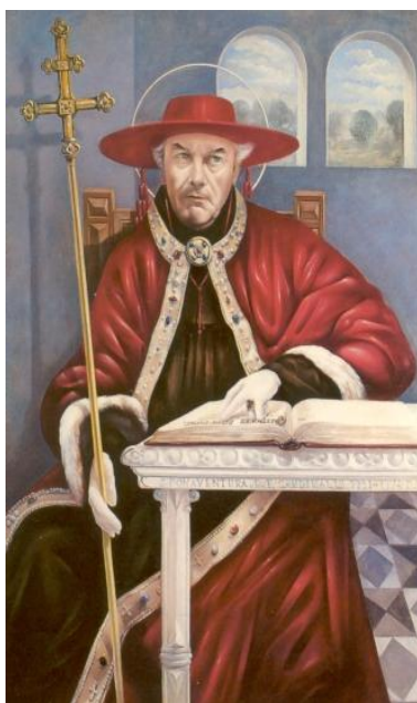
Schilderij door Rik Verhelst, vóór 2000. België, Hasselt, gedachtenishuis Valentius Paquay.

Afgelopen week was op 14 en 15 juli het feest van de Heilige Bonaventura, bisschop van Albano. U hebt daar in de vorige Weekbrief over kunnen lezen. Van Bonaventura is de volgende tekst, vol diepgang en gelaagdheid die de moeite waard is om regelmatig te herlezen.