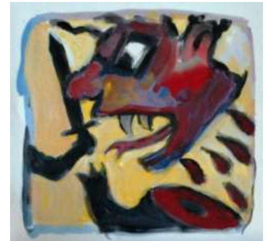
De Griekse held Perseus hakt het hoofd af van het monster 'Medusa': het symbool van hebzucht, onderdrukking en dood. (afb. van Harrie Geelen)

– Zou een 'schuldige wereld' noodzakelijk zijn als uitdaging om het goede na te streven en zal het ooit zover komen, dat de 'zachte krachten zullen overwinnen aan het eind'?