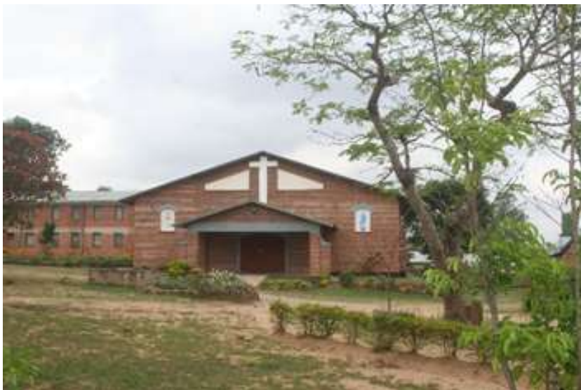
Kerk bij het moederhuis van de zusters in Malawi

Hoe kan je in deze verwarrende tijd een goede boodschap overbrengen uit een land hier ver vandaan, waar ook het leven van de mensen door Corona wordt beheerst?