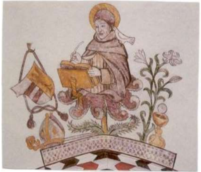
Wandschildering < 1525. Zwolle, Broerenkerk.

Thomas werd rond 1225 geboren in het Italiaanse plaatsje Roccasecca bij Aquino. Voor zijn vorming werd hij toevertrouwd aan de benedictijner monniken van, maar na enige tijd voelde hij zich aangetrokken tot de zojuist door de Spanjaard Dominicus Guzmán gestichte orde der predikheren, de Dominicanen.