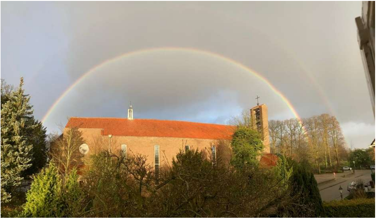
Een mooie foto van onze kerk onder een regenboog