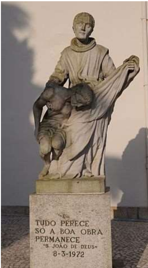
Standbeeld van Johannes de Deo in Vilar de Frades, Barcelos, Portugal.

Johannes de Deo , Granada, Spanje; stichter & verpleger; † 1550 . Feest 8 maart.