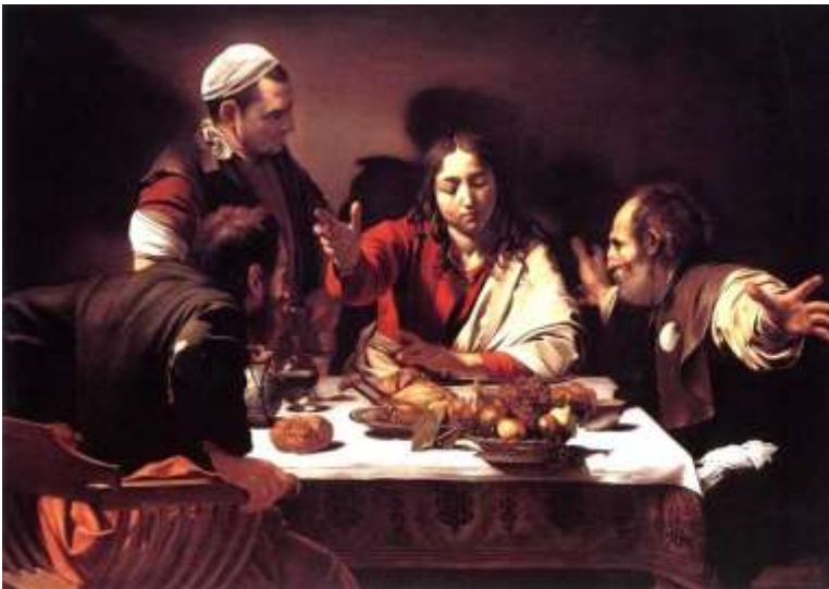
Avondmaal in Emmaüs van Caravaggio (1601)

Ignis is een webmagazine over geloof, spiritualiteit en samenleving van de Nederlandse en Vlaamse jezuïeten ( www.igniswebmagazine.nl ) . Vanuit de eeuwenoude ignatiaanse spiritualiteit kijkt Ignis naar het christelijk geloof en de wereld om ons heen.