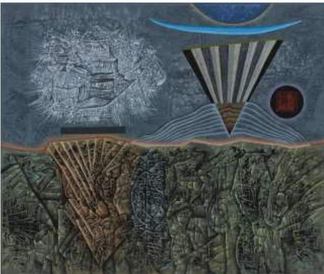
'De Raadsels ontvouwen' (Museum Boijmans Van Beuningen)

Gelukkig is er weer ruimte voor een 'live' Vriendschapsviering samen met leden van de Paaskerk, ditmaal bij ons in de kerk. Het thema van deze viering is 'Ontvouwen'.