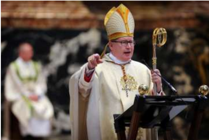
Kardinaal Eijk tijdens een viering in de Sint-Pietersbasiliek in Rome.

De katholieke kerk trekt zich terug uit het Oecumenisch Brandpunt in Amersfoort. Officieel om te bezuinigen. Binnen de geloofsgemeenschap voelt het als een klap voor de oecumene.