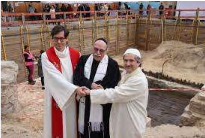
De oprichters van het gebedshuis: de pastoor, de rabbi en de imam.

Aan de andere kant is er ook verheugend nieuws. Onder de kop: ‘Alle katholieken verzamelen’ , schrijft Stijn Fens in Trouw over een synode nieuwe stijl, die in 2023 in Rome zal worden gehouden. Ook lazen wij in de krant over een plek in het centrum van Berlijn, waar een priester, een rabbi en een imam samen een multi-religieus centrum hebben opgericht tot lering en inspiratie van velen. Misschien iets voor de Maria Koningin in een niet al te verre toekomst ??