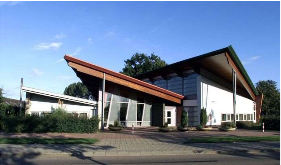
Oecumenisch Centrum 'HET BRANDPUNT'