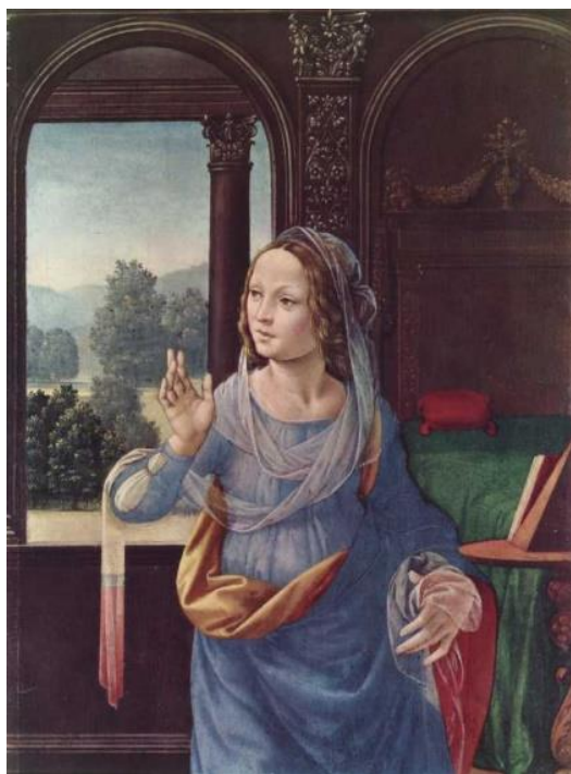
ca 1500. Schilderij door Lorenzo di Credi. Detail van 'Annunciation'.

Maar de engel zei tot haar: "Vrees niet Maria, want Ge hebt genade gevonden