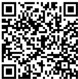
Collecte eigen kerk