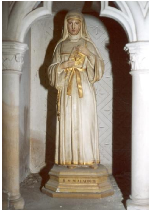
ca 1920. Gipssculptuur Frankrijk, Plailly, St-Martin.

Aanvankelijk stuitte deze devotie op weerstand van binnen de kerk; vervolgens kreeg ze tegenstand te verduren van de jansenisten , maar uiteindelijk kwam ze tot grote bloei in de geloofsgemeenschap. Marguerite-Marie werd in 1920 officieel heilig verklaard.