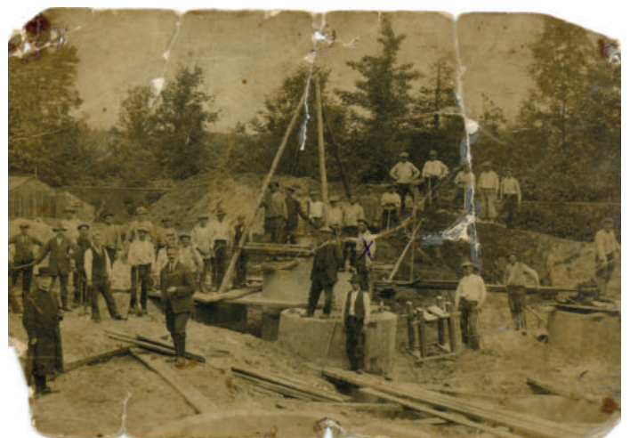
Met op de foto o.a. pastoor H.S. Mölder (met zwarte hoed en lange jas links)

P.S. Op de website staan de foto's groter uitgebeeld met daarop ook nummers bij de personen.