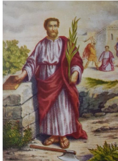
Sint Matthias, Apostel

De heilige Matthias is een belangrijke weerheilige. Vriest het op zijn feestdag, dan vriest het nog zes weken: "Als Sint Matthijs geeft sneeuw en ijs, kan men verwachten dat het zal vriezen nog veertien nachten." Omdat het op 24 februari ook wel eens zacht kan zijn, is de volksweerkunde ook daarop