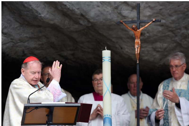
Foto impressie van de Lourdes bedevaart, zie ook; https://www.aartsbisdom.nl/home/nieuws/