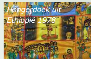
Hongerdoek uit Ethiopië 1978

035 – 60 259 51 richard.vandeloo@planet.nl