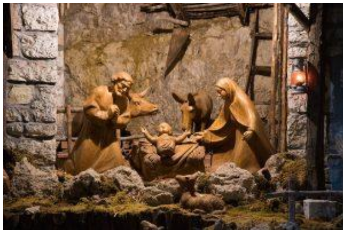
kerststal in Greccio

Op 24 december 2023 is het precies 800 jaar geleden dat Franciscus van Assisi in het stadje Greccio in Italië een levende kerststal liet inrichten. Franciscus vond dat zijn tijdgenoten weinig oog en begrip hadden voor de menselijke kant van het kerstverhaal. Daarom besloot hij het zichtbaar te maken. Midden in de bossen van Greccio creëerde hij een stal met een kribbe, een ezel en een os. Deze eerste levende kerststal was de opmaat voor een traditie die nog altijd actueel is. Op tal van plekken – thuis, op school, in de kerk en op straat – wordt de geboorte van Christus uitgebeeld met de kerststal.