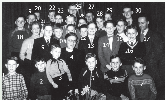
Groepsfoto misdienaars Petrus en Pauluskerk jaren '50

In deze aflevering over de Kerkhistorie van Soest en Soesterberg gaan we terug naar de jaren '50 en '60. Een van onze parochianen kwam bij het doorspitten van zijn fotoboeken een afbeelding met een groepsfoto van misdienaars tegen die actief waren in de Petrus en Pauluskerk in Soest.