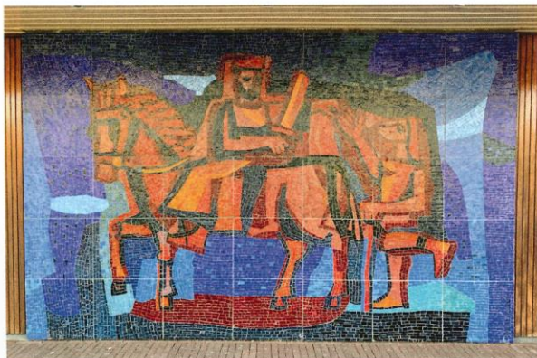
Het mozaïek van St. Maarten in Maartensdijk

Aan de buitenzijde van de Heilige Geestkerk in Enschede kwam ook een sgraffito, maar omdat