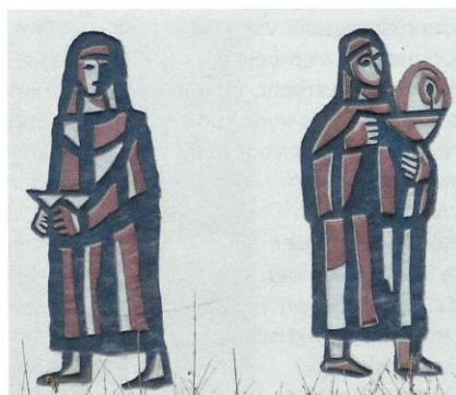
Een dwaze (links) en een wijze (rechts) maagd in Baarn

van het Tweede Vaticaans Concilie (1962-1965) en van de gedachte dat voorganger en gelovigen een eenheid vormden, wat goed terug te zien is in zijn ontwerpen. Het betreft vooral zaalkerken, met (onregelmatige) zeshoekige of vijfhoekige grondplannen