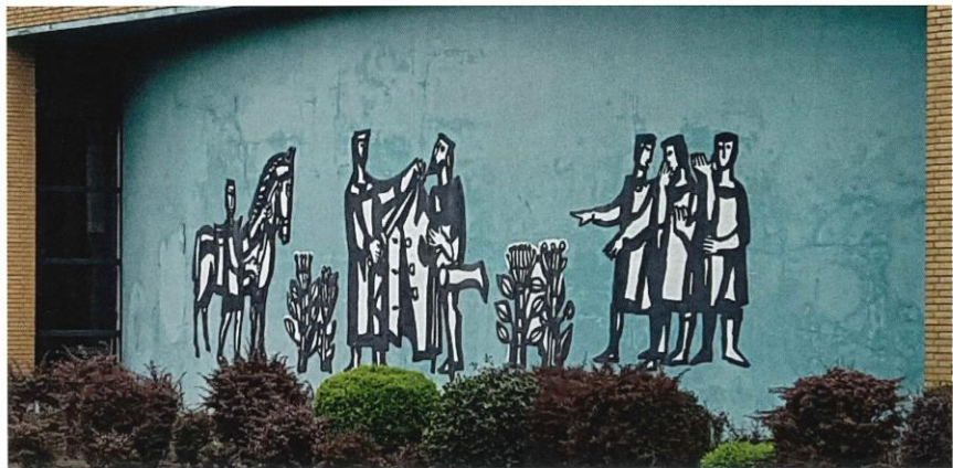
Het sgraffito van Sint Maarten op de St. Maartenskerk te Losser