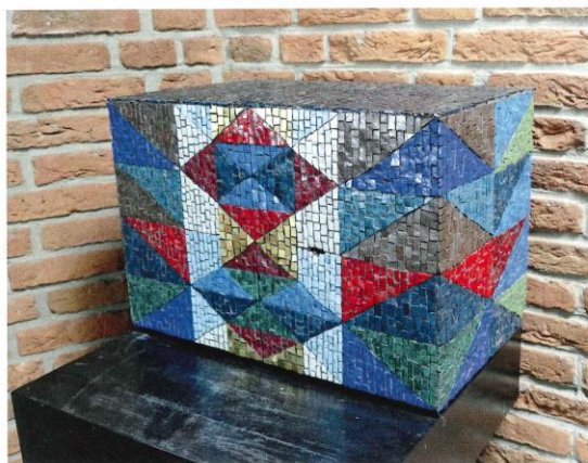
Het tabernakel in de Maria Koninginkerk te Baarn

De kerken van Knoop werden allemaal opgetrokken in eenzelfde stijl en ademen dezelfde serene en imposante sfeer. Het waren kerken met vrijstaande toren in een sobere, functionalistische trant – vorm en uiterlijk werden bepaald door de functie van het gebouw. Knoop ging uit van de liturgische richtlijnen