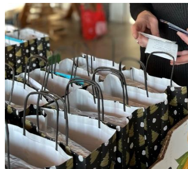
Een WOD-activiteit: het klaarmaken van tasje voor

Mensen kunnen om allerlei redenen opeens in een sociaaleconomische probleemsituatie terecht komen. Dan is het goed als je ergens kunt aankloppen voor financiële of praktische hulp. Christelijke geloofsgemeenschappen, zo ook die in De Bilt, Bilthoven en Den Dolder, hebben vaak een vangnet om aangesloten leden of gezinnen in nood dit soort hulp te bieden. Voor mensen in financiële nood die niet op een eigen kerk kunnen terugvallen hebben de christelijke geloofsgemeenschappen in De Bilt, Bilthoven en Den Dolder een kerk-overstijgende werkgroep die zich voor hen inzet: de Werkgroep Oecumenisch Diaconaat ( WOD ). Diaconaat betekent letterlijk 'je dienstbaar opstellen of hulp bieden aan de medemens die dit nodig heeft'.