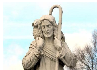
Afbeelding van Jezus als de Goede Herder

De Wereldgebedsdag voor Roepingen wordt jaarlijks gevierd op de vierde zondag van Pasen, ook wel Goede Herder-zondag genoemd. De dag is bedoeld om wereldwijd aandacht te vragen voor roepingen binnen de Kerk en om te bidden voor hen die zich geroepen weten tot een bijzondere vorm van dienstbaarheid.